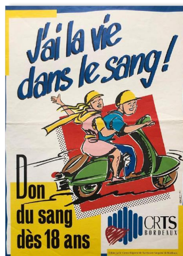
Anciennes affiches de promotion du don de sang des Centres de transfusion sanguine